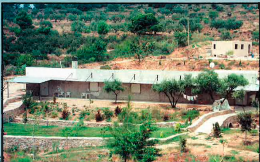
Búnquer que els seguidors d'Energia Universal i Humana havien construït a l'Aleixar (Baix Camp) per esperar-hi una imminent fi del món que tampoc no va arribar.

cia del dimoni. Els fidels han de pagar mensualment el delme –un 10% dels seus ingressos que, en alguns casos, es pot duplicar i triplicar–. També és imprescindible que els adeptes aconseguixin captar nous membres, i augmentar així la Legió del Bé. Afirmen que compten amb 6 milions de fidels a una vintena d'estats i que als Països Catalans tenen seus a Barcelona i València.