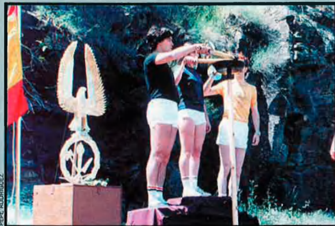
Nova Acròpoli. Sota l'aparença de cursos o conferències filosòfiques, la ideologia d'aquest grup s'acosta al totalitarisme filonazi.

Entre aquest testimoniatge i les reunions i assemblees als "salons del regne" s'han d'arribar a complir unes 90 hores de dedicació mensual. Son 6 milions de fidels a tot el món i 30.000 als Països Catalans.