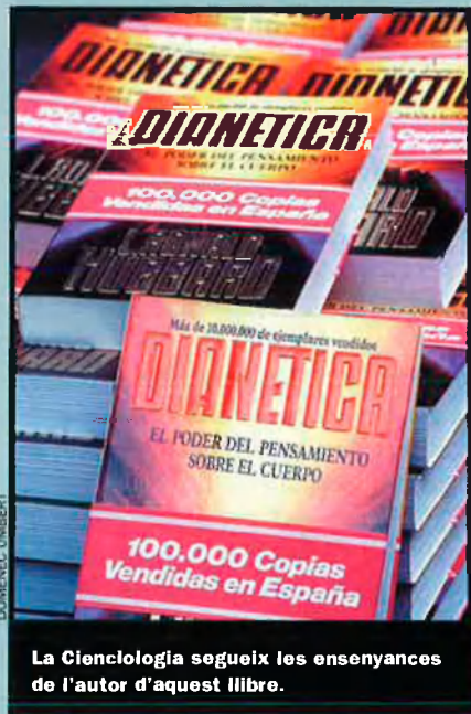
La Cienciologia segueix les ensenyances de l'autor d'aquest llibre.

Fundada el 1954 a Los Angeles (EUA). Afirmen que poden eliminar els engrames –producte de la ment reactiva– i afavorir el desenvolupament de la ment analítica per arribar a un estat mental clear (clar). Els seus cursos poden arribar a costar 60.000 euros, i el paquet complet al voltant dels 350.000 euros. Fan audicions, exàmens en els quals s'utilitza la hipnosi, que poden arribar a durar 12 hores. Dels 8 milions de seguidors que tenen al món, 10.000 es distribueixen en centres com els d'Alacant, Barcelona i València (vegeu EL TEMPS número 1004).