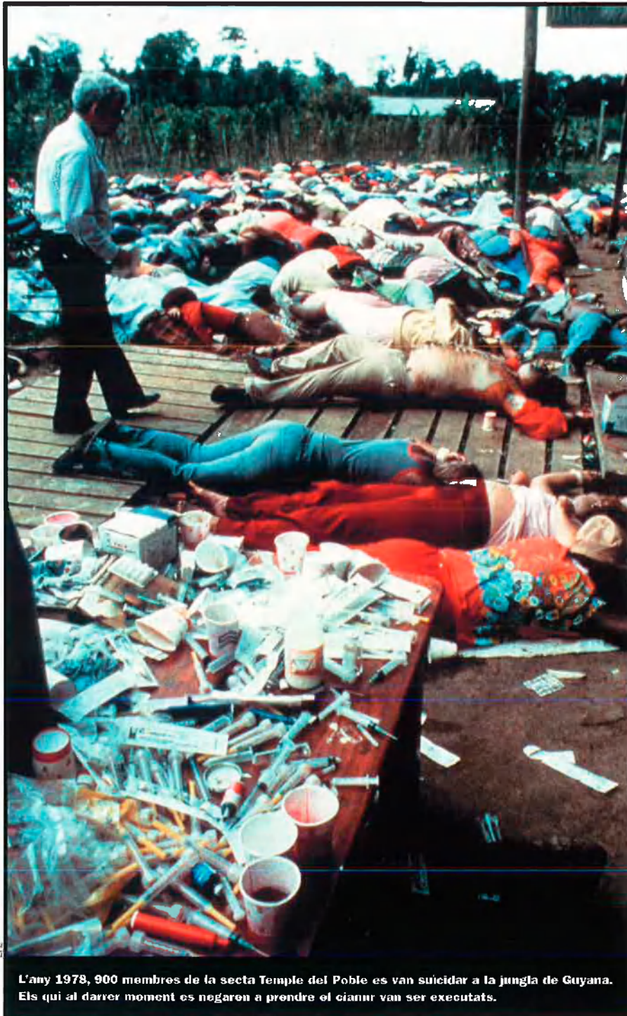
L'any 1978, 900 membres de la secta Temple del Poble es van suïcidar a la jungla de Guyana. Els qui al darrer moment es negaren a prendre el cianur van ser executats.

se mundial –com Nova Acròpoli–, fins a falses multinacionals de la solidaritat –Humana-Tvind–, passant per la més rànica interpretació de la doctrina catòlica, representada pels Legionaris de Crist.