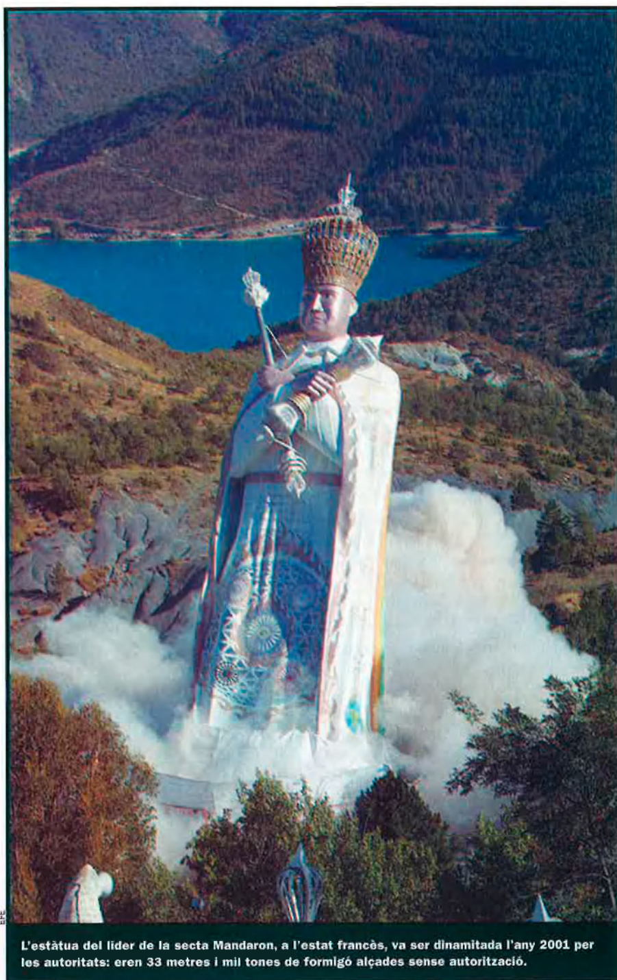
L'estàtua del líder de la secta Mandarón, a l'estat francès, va ser dinamitada l'any 2001 per les autoritats: eren 33 metres i mil tones de formigó alçades sense autorització.