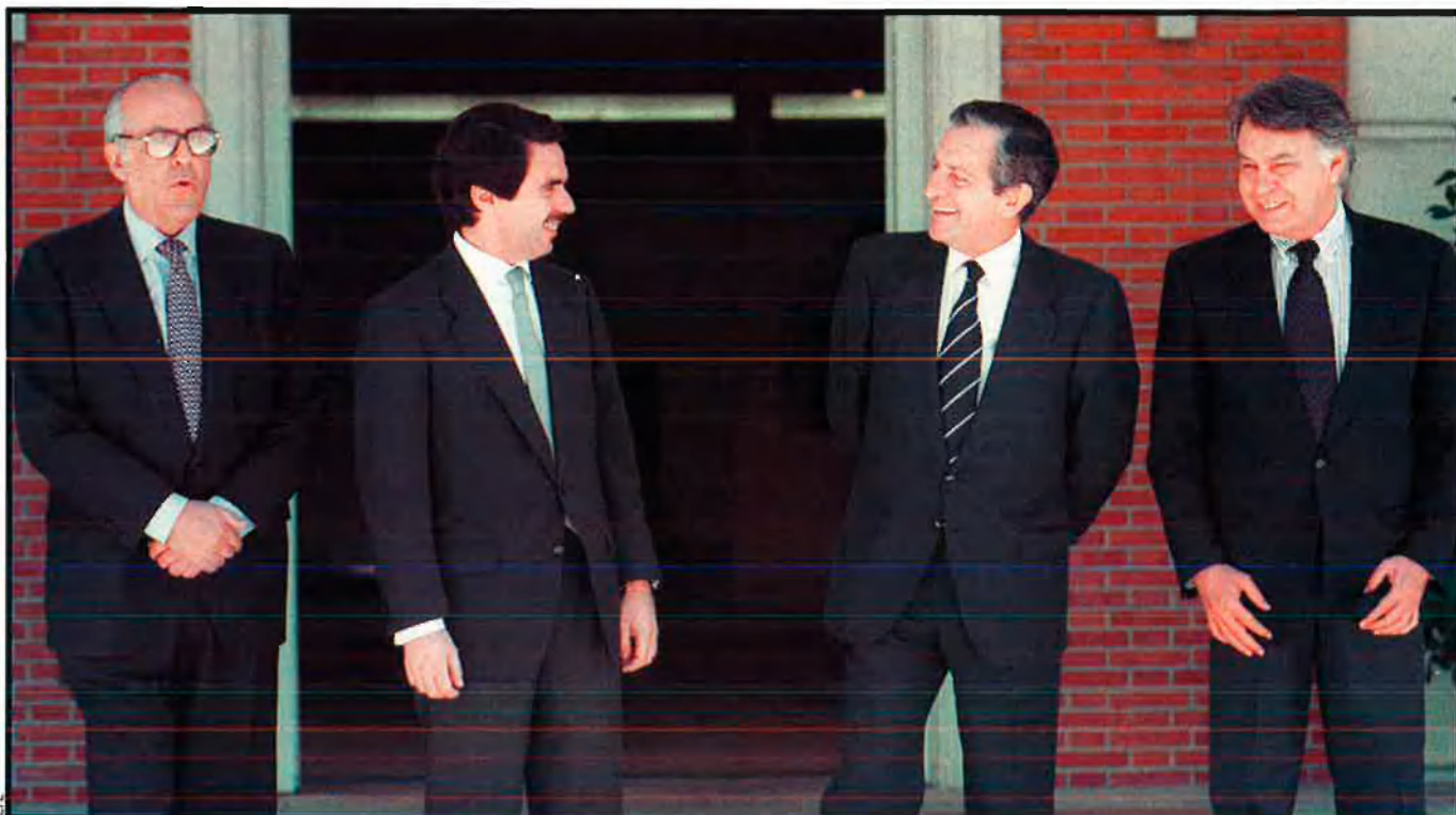
Leopoldo Calvo Sotelo, José María Aznar, Adolfo Suárez i Felipe González, els quatre presidents del Govern espanyol des de la mort de Francisco Franco. Ara l'estat vol recuperar algunes de les competències que es van traspasar a les comunitats autònoms durant la transició.

A la recambra. Aquests són alguns dels exemples de les iniciatives a través de les quals l'executiu popular ha retallat implacablement el marge de capacitat d'acció de les administracions autonòmiques. Però encara n'hi ha més de previstes.