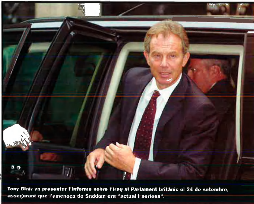
Tony Blair va presentar l'informe sobre l'Iraq al Parlament britànic el 24 de setembre, assegurant que l'amenaça de Saddam era "actual i seriosa".