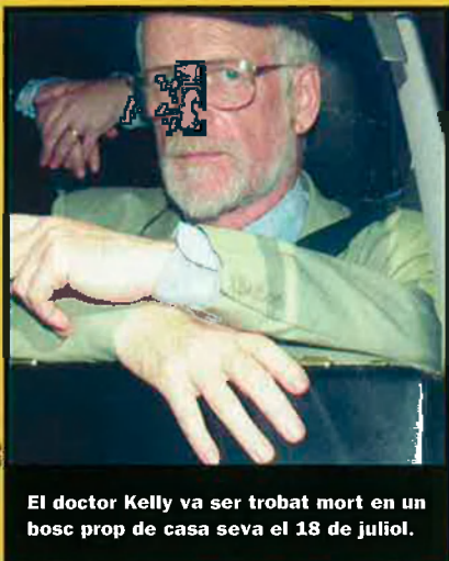
El doctor Kelly va ser trobat mort en un bosc prop de casa seva el 18 de juliol.

7 de juliol. Blair discuteix amb els seus assessors què fer del cas Kelly. Li diuen que Kelly estava a favor de la guerra contra l'Iraq, però que, alhora, si declara en públic, pot dir algunes inconveniències.