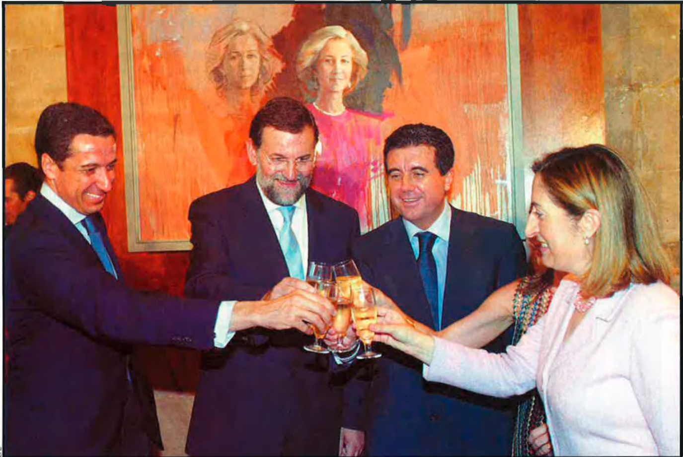
Zaplana, Rajoy i Matas brinden amb la ministra de Sanitat, Ana Pastor. Tots quatre tenen una bona relació, tot i que els tres homes han aprofundit més en aquesta amistat en compartir vacances i conveniències. En la campanya estatal, Zaplana serà un dels homes decisius.