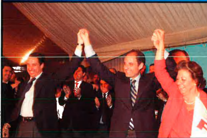
Dalt, Zaplana, Matas i Rajoy, en una final de Roland Garros. Enmig, Rajoy dona suport a Camps, al costat de Zaplana, en plena campanya autonòmica. Baix, Rita Barberà, Zaplana i Francesc Camps, el passat 25 de maig.