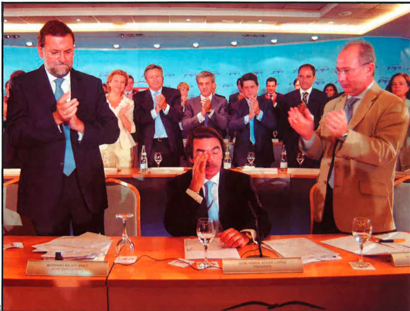
José María Aznar plora en rebre els aplaudiments dels membres de la Junta Directiva Nacional, el passat dia 2, després que aquest òrgan aprovés la candidatura de Mariano Rajoy a la presidència del Govern espanyol gairebé amb unanimitat: 503 vots a favor i una abstenció.

lització de l'esquerra independentista basca-. D'entre els aspirants, el seu sembla el relleu polític més baix, i per això, alguns, com el president del Senat, Juan José Lucas, no s'estan de titllar-lo d'"humanista" a l'hora de triar una floreta.