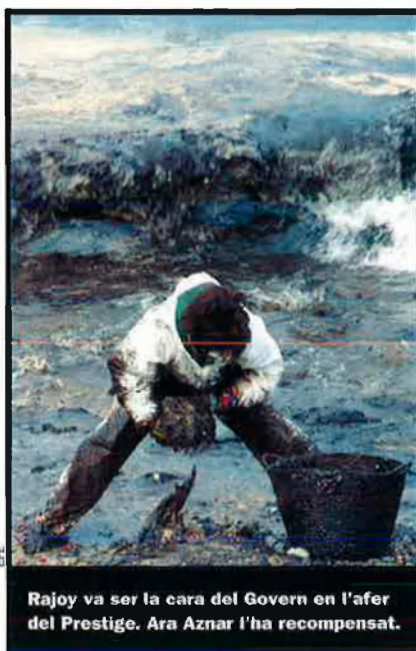
Rajoy va ser la cara del Govern en l'afar del Prestige. Ara Aznar l'ha recompensat.

A la primavera, amb l'assumpte de l'Iraq ja de baixa i amb l'estrella de Mayor Oreja en declivi absolut després de la relliscada pressupostària i el fracàs del front espanyolista PP-PSE al País Basc, el cap de l'executiu espanyol li va encarregar dissenyar una "resposta" al pla Ibarretxe. No va ser doncs casual que fos ell qui el 30 de juliol va dinar en secret a Madrid amb José Luis Rodríguez Zapatero per tractar "assumptes d'estat". El mateix Zapatero que, ves per on, va afirmar el 20 de maig del 2001 a Mèrida, en una conversa informal de matinada amb periodistes —qui això signa hi era—, que Rajoy era el seu favorit en la cursa. Perquè el veia ben col·locat i perquè el consi-