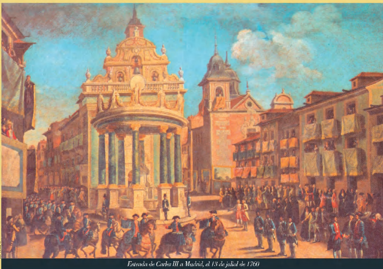
Entrada de Carlos III a Madrid, el 13 de juliol de 1760

te”, les autoritats havien decidit guardar el cas en secret, enviar la dona a l’estranger i alliberar el cavallerós venecià.