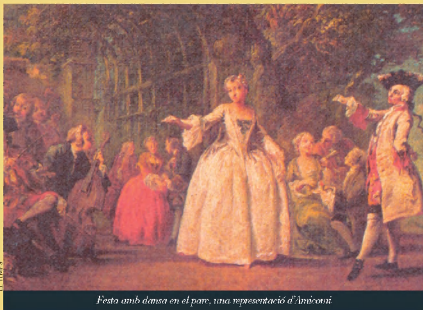
Festa amb dansa en el pare, una representació d'Amicomi

li va quedar la marca d'un tret que de poc no l'encertà. L'endemà, en desparar-se, "tenia el llit voltat d'esbirros; em van prendre tots els papers, em van detenir i ja em teniu a la Ciutadella. Em paren un mal jaç, em donen la capa, posen el forrellat a la porta i em quede submergit en les meues reflexions".