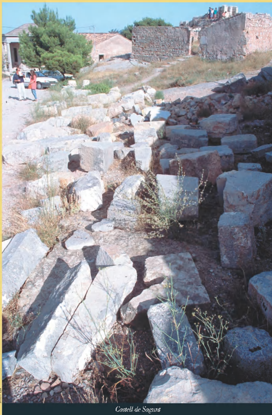
Castell de Sagunt

Però un paradís terrenal no podia ser complet per al nostre viatger sense una bella companyia femenina. Assistint a una correguda de bous, Casanova va distingir entre el públic una dona “molt bonica i vestida amb gran elegància”. Resultà ser una ballarina italiana anomenada Nina, que aleshores era l'amistança del capità general de Catalunya, el comte Ricla. Per pressions del