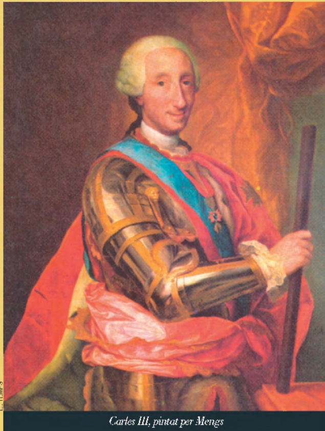
Charles III, pintat per Mengs

Casanova té el cor joiós i es prepara per a l'escena final d'aquesta apassionada trobada, però en córrer les cortines, tot canvia de sobte: "Damunt del llit hi havia un cadàver, el cadàver d'un home jove, de fesomia molt escaient; el