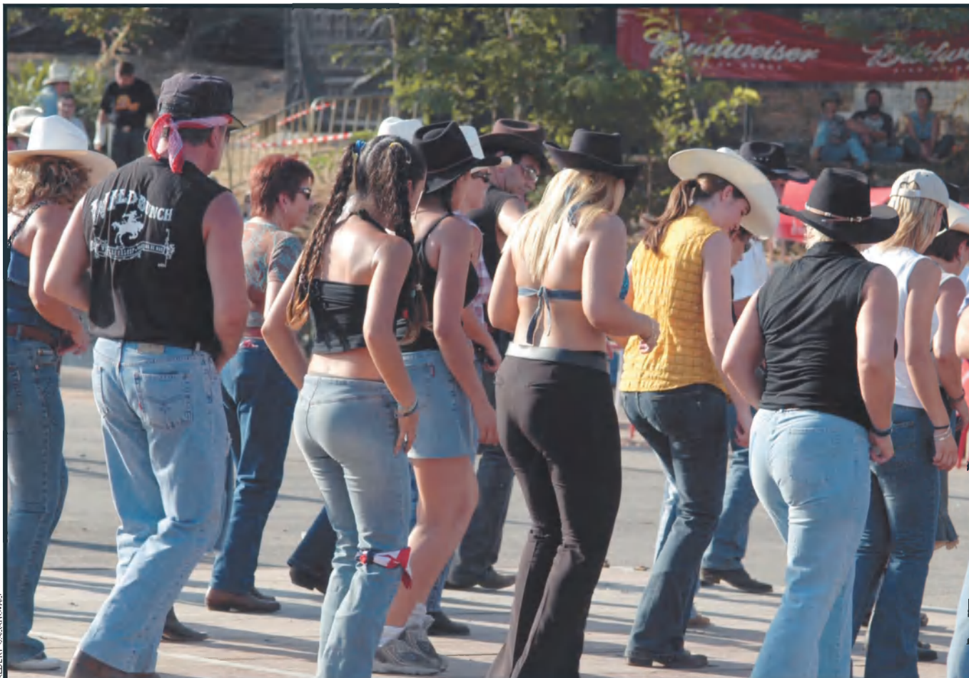
Imatge del III Mr. Banjo Country Music Festival, esdevingut a Terrassa el passat juliol. S'hi van aplegar sis artistes internacionals, exhibicions de doma western, una mostra de line dance, una altra de motos custom i un mercat d'artesanía i moda country.