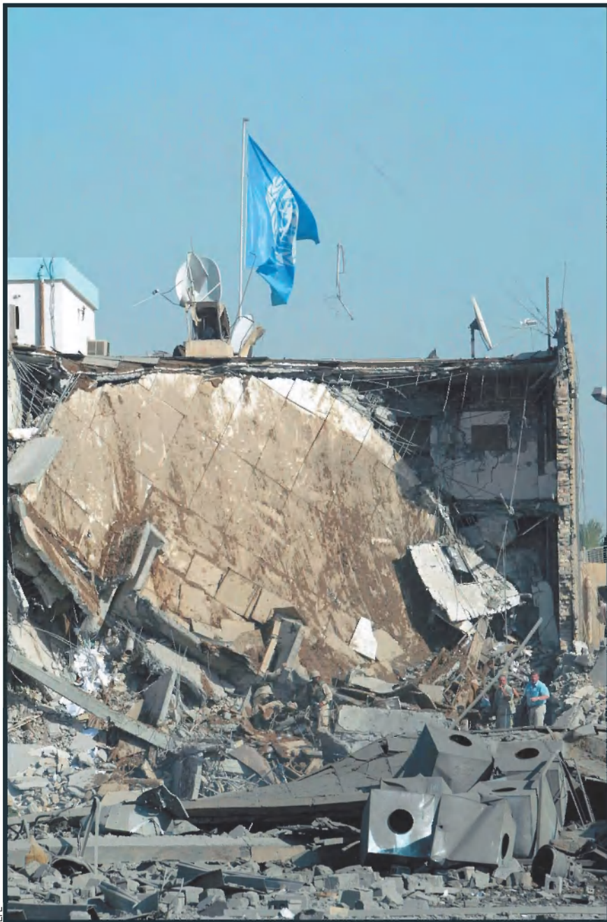
L'atemptat contra la seu de les Nacions Unides a Bagdad, el passat dia 19, ha estat el més greu que ha patit l'ONU en tota la seva història.

passat terrible on, malgrat la repressió, el país funcionava i en què un mínim de seguretat (treball, habitatge, alimentació, sanitat i educació, sempre precaris, això sí, a causa de l'embargament i l'ús que el règim feia del programa Petrolí per Aliments per premiar fidelitats) era garantida.