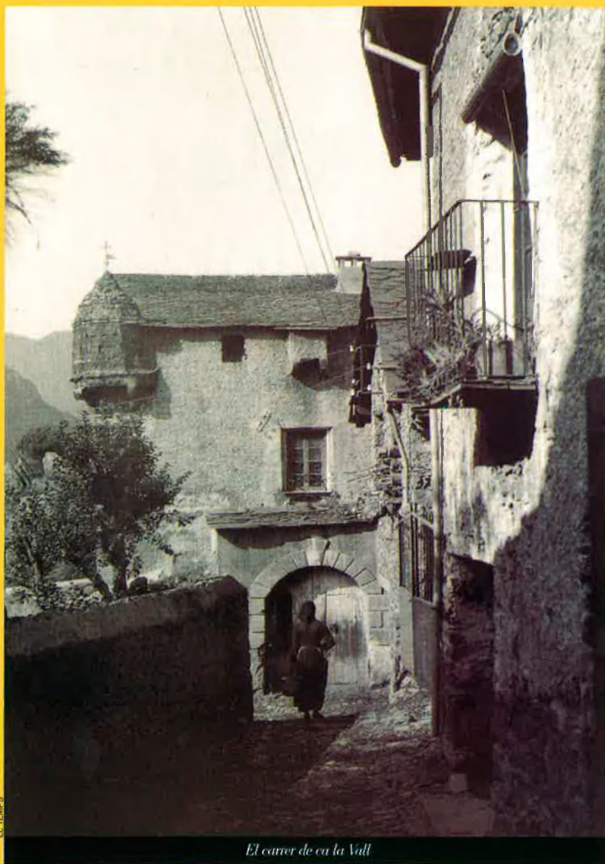
El carrer de ca la Vall

La visita del polític i escriptor escocès a l'exòtica i "eterna" Andorra va ser breu, però va servir sobretot per