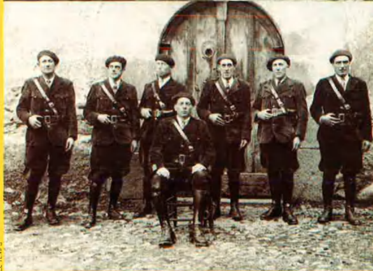
Dalt, el tabac al sol. Al costat, el primer cos de policia andorrana.

tisfer la voluntat popular: "Tristament, muntat en una egua, em vaig obrir pas entre la multitud, procurant semblar, de la manera més gallarda possible, un artista eqüestre (tot i que era conscient del meu fracàs); perquè procurar plaer als nostres semblants ha de