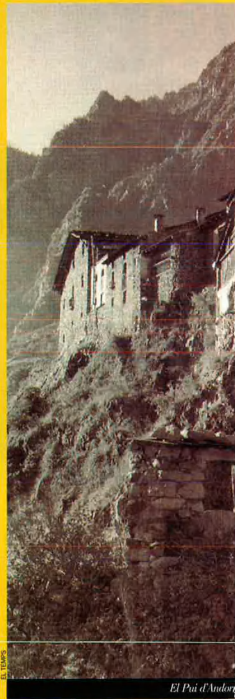
El Pui d'Andorra