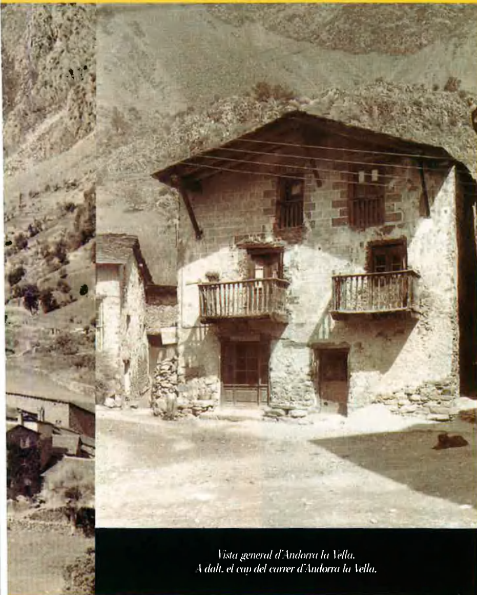
Vista general d'Andorra la Vella. A dalt, el cap del carrer d'Andorra la Vella.