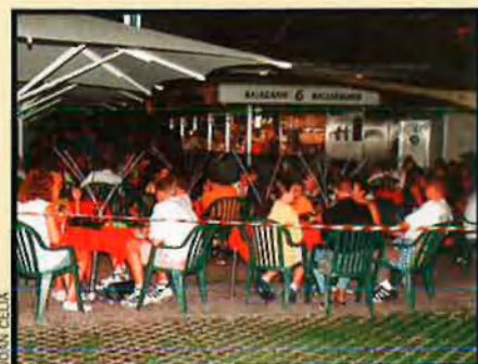
Els alemanys són majoria entre els estrangers residents a les Illes Balears.

Segons aquest informe, el 20% dels 141.000 habitants estrangers de les Illes són alemanys. El perfil d'aquests residents és el de "jubilat o prejubilat de classe mitjana-alta que ja van ser turistes als anys seixanta o setanta".