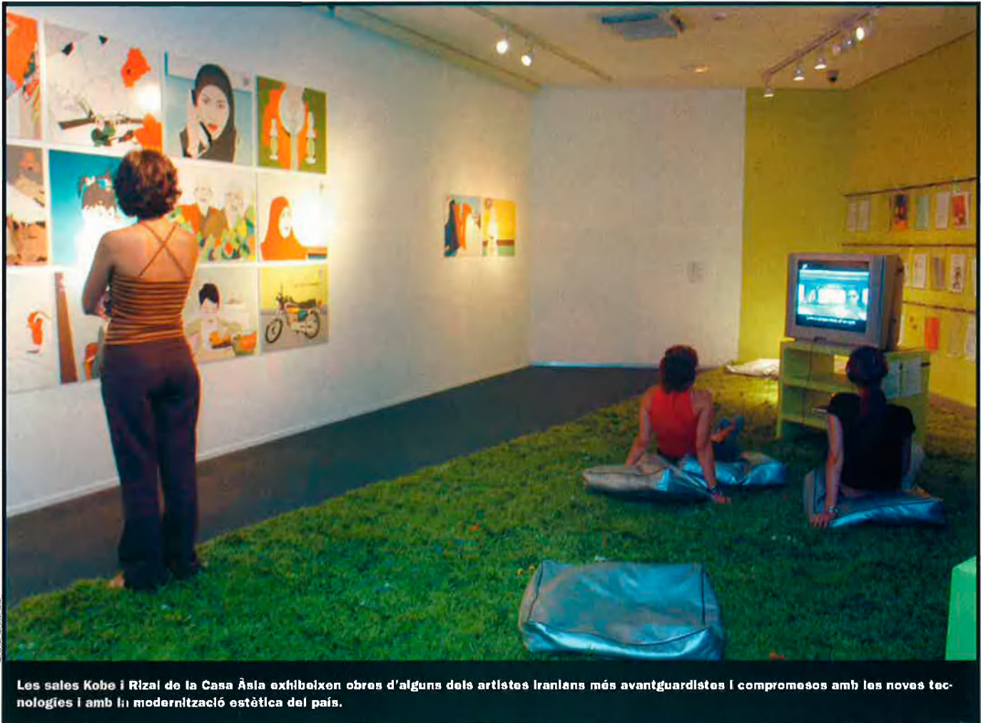
Les sales Kobe i Rizal de la Casa Àsia exhibeixen obres d'alguns dels artistes iranians més avantguardistes i compromesos amb les noves tecnologies i amb la modernització estètica del país.

remot del vídeo) les formes audiovisuals que prenen emergència en la formació d'una cultura iraniana pop vinculada als mitjans de comunicació, que està plena de contradiccions que fascinen i alhora ha estat feta cent per cent a l'Iran".