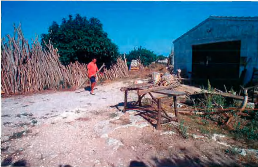
FRATS I CAMPS

corxar, amb tot el seu aspecte forestal d'haver-les acabat de tallar. Així s'assequen, i si algun dia plou, l'acció de l'aigua sobre aquestes és menor que si es tinguessin tombades horitzontalment. La pluja hi regalima, i la fusta no s'abeura tant. Des d'ara i fins al final de setembre és l'època propícia per tallar la rama. La temperatura eixuta de l'estiu fa que l'assecada sigui molt més sana i segura. S'evita que les eines que hi surtin tinguin tendència a trencar-se aviat, o a podrir-se abans d'hora. La selecció de la rama, però, la fan els llenyataires amb carnet professional, i sempre sota la supervisió ocular dels guardes forestals de la Conselleria balear.