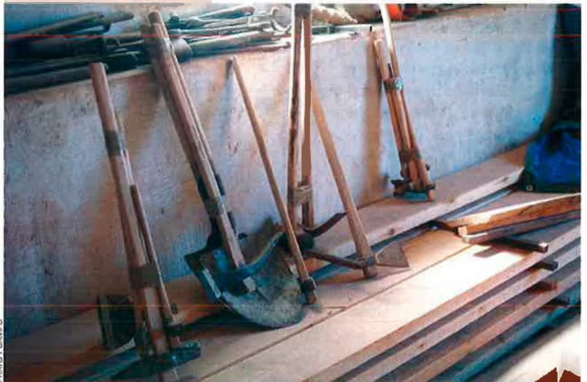
FRATS I CAMPS

És ben curiós, aparentment paradoxal, però el model social i econòmic turístic, el mateix que ha precipitat l'extinció de tants d'oficis seculars, és el