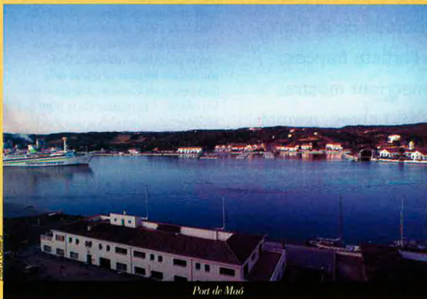
Port de Maó