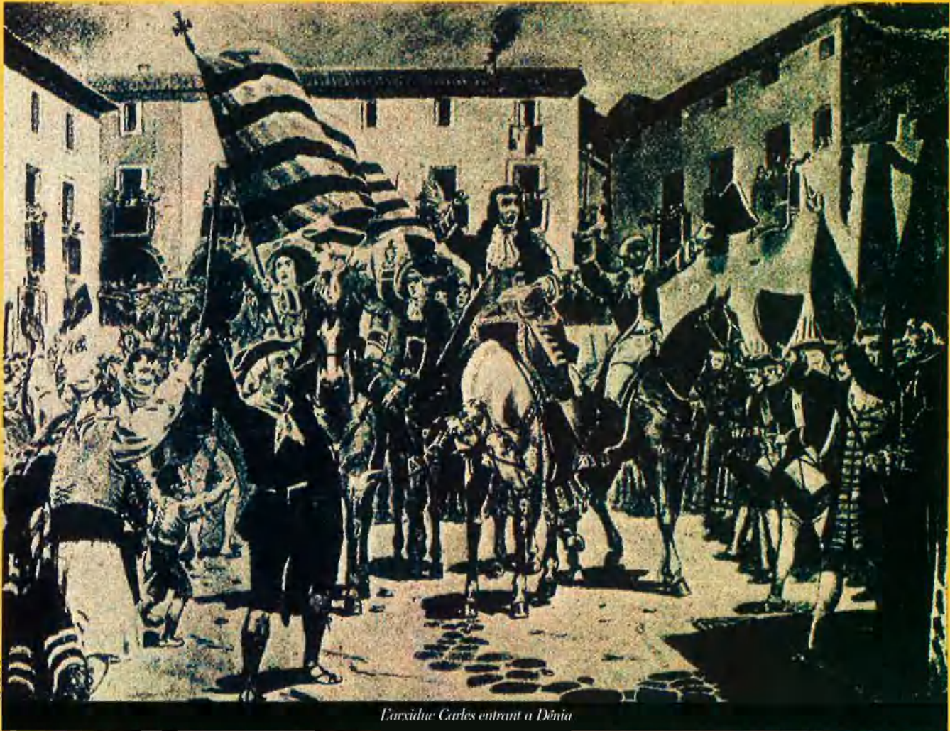
L'arxiduc Carles entrant a Dènia

escarpat i menys fèrtil que el de Grècia. És una roca àrida, quasi perpètua, o millor, un munt de roques reunides, entre les quals es troben pocs intervals passadament agradables. La Verge té una església acompanyada d'un monestir. Aquesta església és de les més ben situades. [...] Diuen que aquesta estàtua [la de la mare de Déu de Montserrat] va ser trobada allí miraculosament, o sense que sapigueren qui o com havia estat duta. És una bella peça d'escultura. Un religiós d'un monestir annex a l'església em digué que era obra dels àngels i no dels homes. No obstant això, n'he vist algunes fetes per la mà dels homes que eren incomparablement més belles, però no vaig trobar oportú de dir-li-ho. L'adornen magníficament