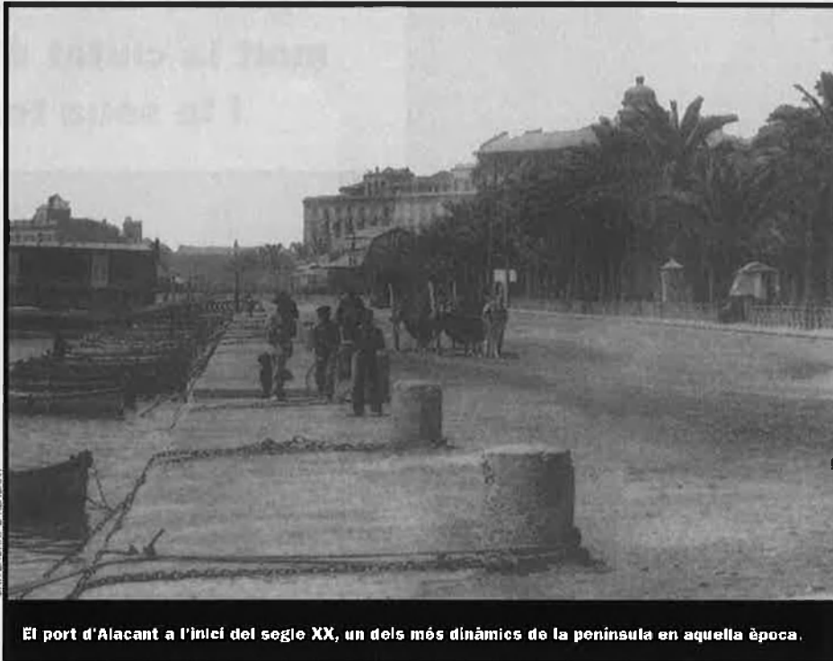
El port d'Alacant a l'inici del segle XX, un dels més dinàmics de la península en aquella època.

El tombant de segle havia vist la consolidació d'una nova professió, la d'economista. Als Estats Units i Anglaterra apareixen les primeres associacions d'economistes i les prime-