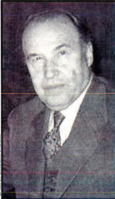
EL TEMPS / UNIVERSITAT D'ALACANT