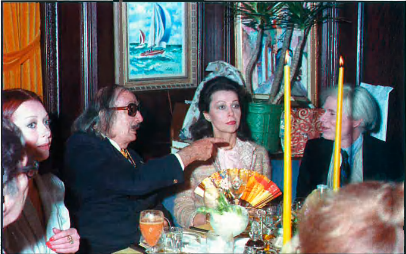
Salvador Dalí, Gala i Andy Warhol en un dels sopars que organitzava el pintor català tots els diumenges. Tots dos artistes necessitaven sentir-se voltats permanentment d'una cort d'ajudants, acompanyants i adúladors que utilitzaven per accentuar el seu prestigi com a creadors de glamour .

Duchamp va aprendre el perfeccionament de la llei del mínim esforç i el concepte de "ready made" —qualsevol objecte, modificat o no, pot ser elevat a obra d'art per voluntat de l'artista—. I de Dalí gairebé tot el que respecta a l'autopromoció i a l'èxit social.