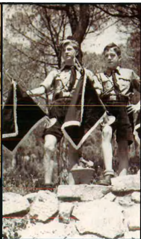
Dalt, a l'esquerra, la badia de Sant Pol tal com era als anys 30. Era la platja més propera per els hostes de la casa de vacances. Al centre, la ciutat de Sant Feliu de Guixols tal com era a principis del segle XX, i a sota, can Casas en l'actualitat. Damunt d'aquestes ratlles, joves hitlerians amb la fanfàrria que els caracteritzava.

no tan coneguda aquesta, d'Albert Soper a Castella. Com es pot veure, el moviment nazi al Principat i a Espanya no va ser pas escadusser.