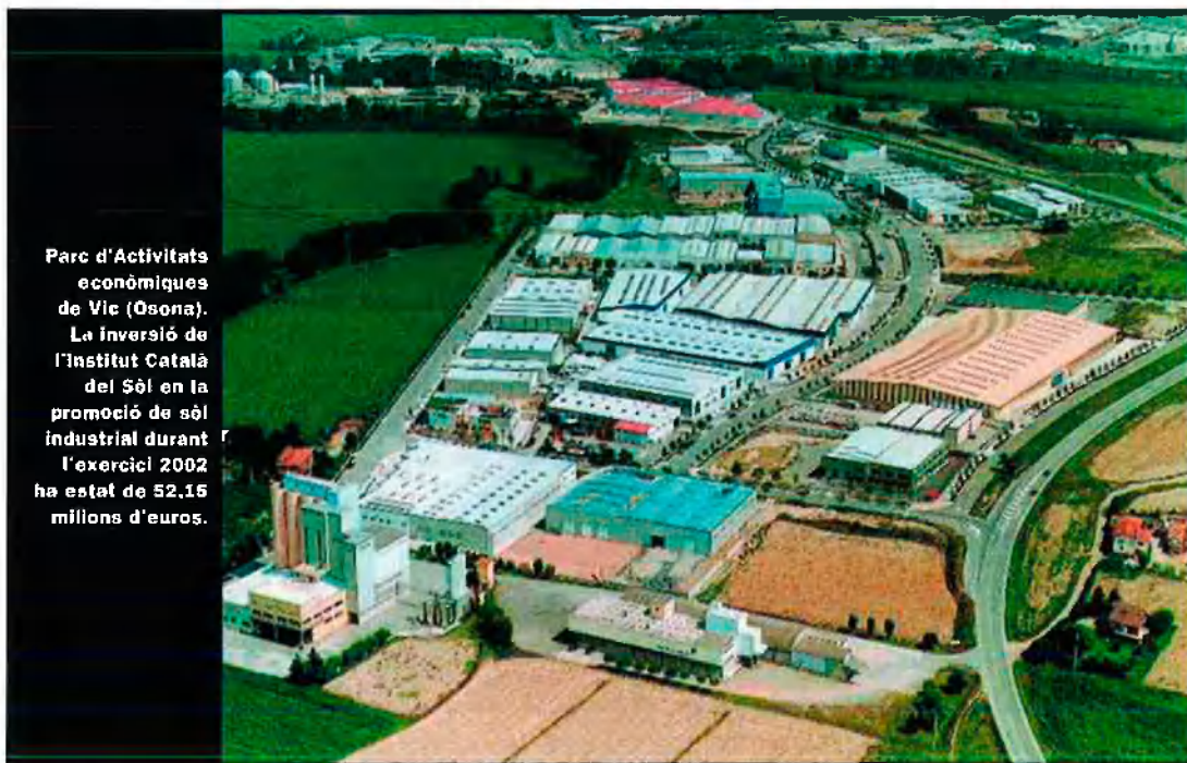
Parc d'Activitats econòmiques de Vic (Osona). La inversió de l'Institut Català del Sòl en la promoció de sòl industrial durant l'exercici 2002 ha estat de 52.15 milions d'euros.