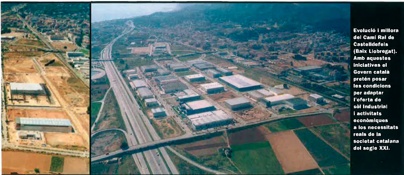
Evolució i millora del Camí Ral de Castelldefels (Baix Llobregat). Amb aquestes iniciatives el Govern català pretén posar les condicions per adaptar l'oferta de sòl industrial i activitats econòmiques a les necessitats reals de la societat catalana del segle XXI.