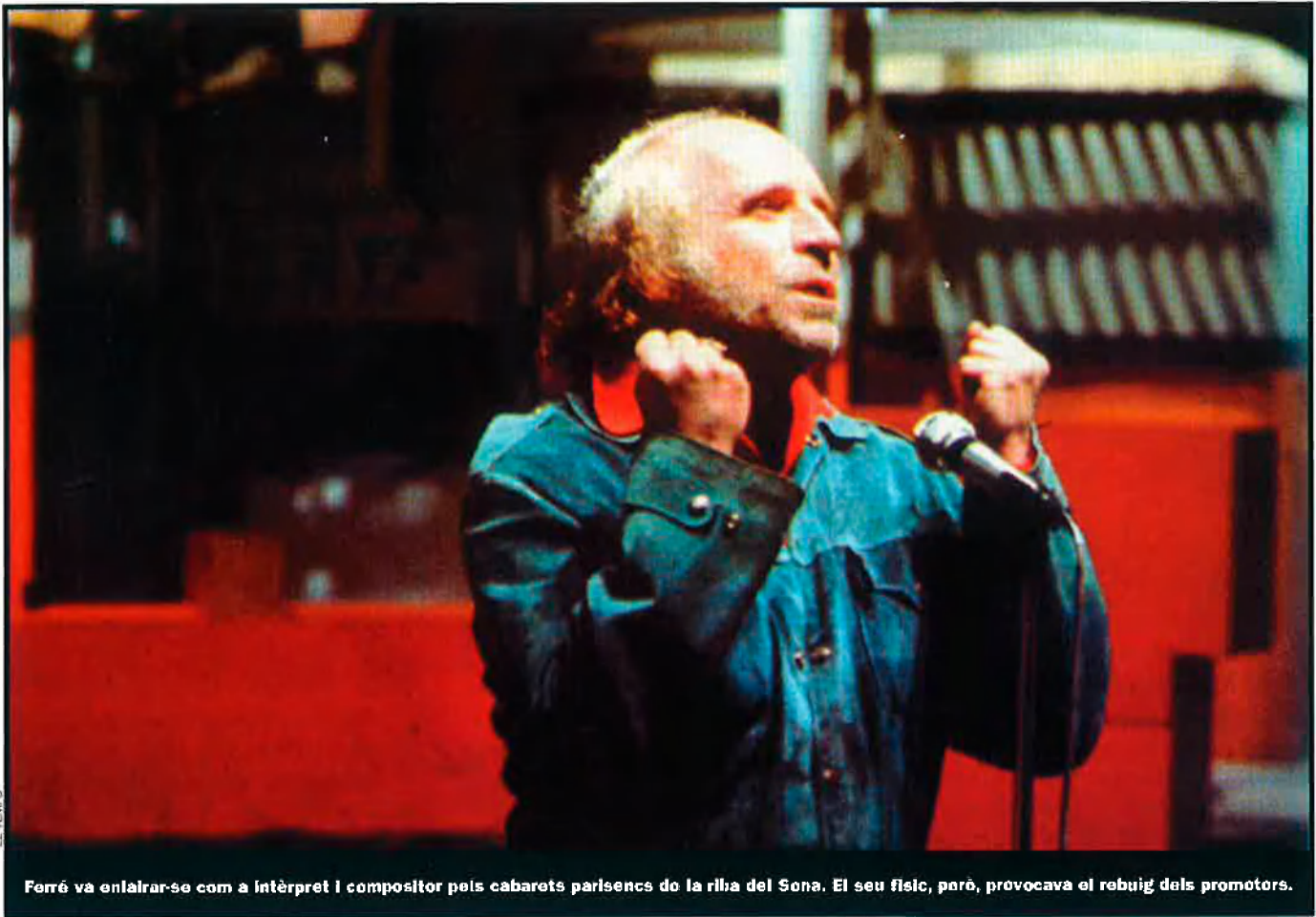
Ferré va enlairar-se com a intèrpret i compositor pels cabarets parisencs de la riba del Sena. El seu físic, però, provocava el rebuig dels promotors.

estudia, entre altres, les carreres de dret i polítiques, i, després de la Segona Guerra Mundial, el 1946, se'n va a París. L'escena musical està protagonitzada per noms com Edith Piaf o Charles Trenet, que han viscut sense sobresalts els anys de l'ocupació. S'hi incorporen noms com Yves Montand, apadrinat per la Piaf, o un Luis Mariano destinat a convertir-se en el rei de l'opereta kitsch fent parella artística amb el compositor Francis López.