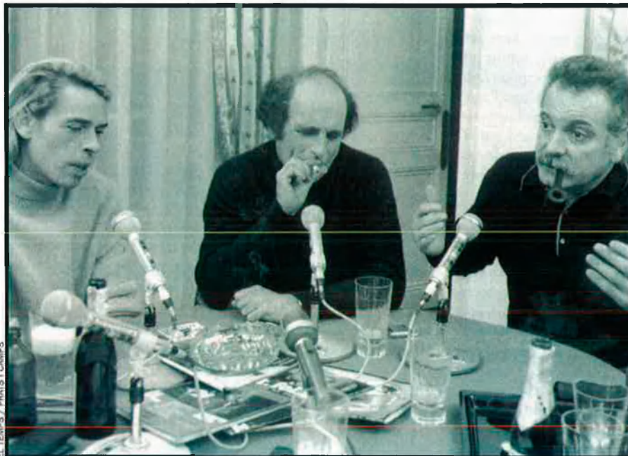
EL TEMPS / PRATS I CAMPS