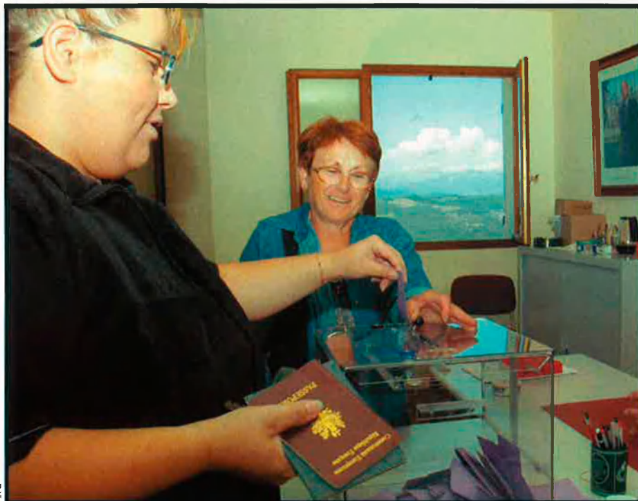
El referèndum per la reforma administrativa de Còrsega es va celebrar el passat 6 de juliol, i la victòria va ser per poc més de dos mil vots en contra de la proposta.

A la vila de Colonna, Carghese, on normalment voten cap a la dreta, el sí va guanyar per 56,49%. Allí totes les càme-