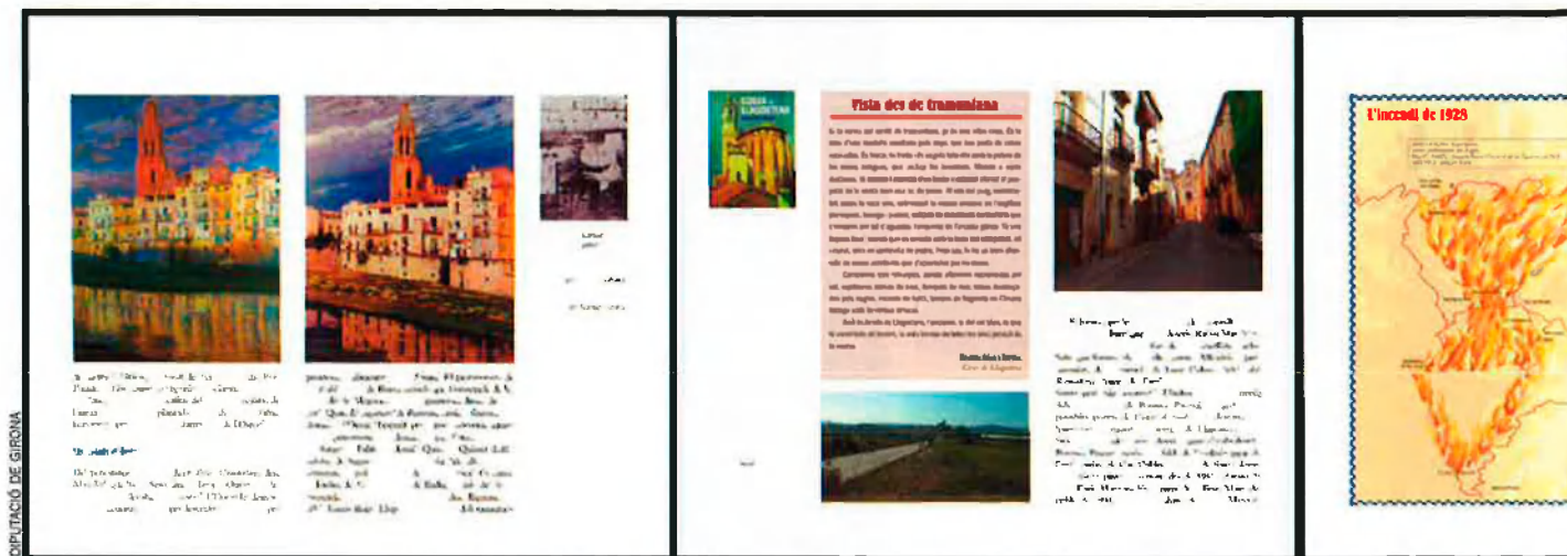
DIPUTACIÓ DE GIRONA