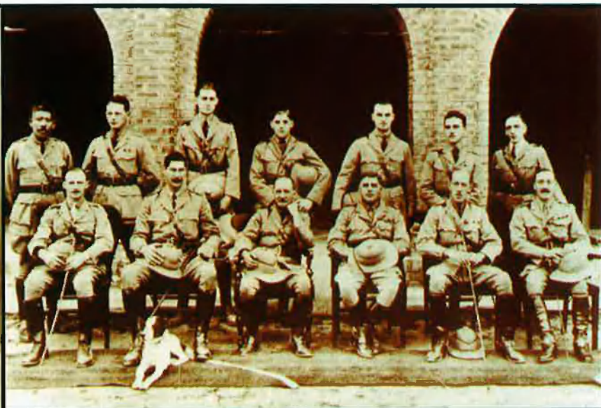
Retrat del jove estudiant d'Eton, Eric Blair, el 1921, ben clenxinat i mudat. Dos anys després, el trobem uniformat a l'acadèmia de policia de Mandalay. És el tercer, dret, des de l'esquerra. La seva gran alçada destacava encara més a la seva època.

Llenguatge. Tenia un gust extrem pel significat correcte dels mots i el seu ús precís. El pensament totalitari comporta la corrupció de la llengua. La perversió de la llengua permet als totalitaris de fer versemblant la mentida.