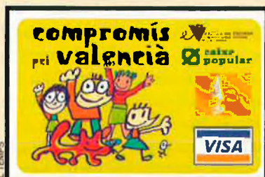
Visa "Compromís pel valencià", una iniciativa d'Escola Valenciana.

Caixa Popular ja ha posat a disposició dels seus clients la targeta Visa "Compromís pel valencià", un producte financer nou que defensa qüestions lingüístiques. De fet, aquesta Visa permetrà als seus titulars, i sense canviar de banc, col·laborar d'una forma fàcil i senzilla amb l'Escola Valenciana - Federació d'Associacions per la Llengua (FEV), ja que fins el 0,7% del preu de les compres que es paguin amb la targeta, Caixa Popular el cedirà a la FEV. D'aquesta manera, la Federació Escola Valenciana troba una forma nova i pràctica de finançar els seus actes de promoció del valencià. La Visa "Compromís pel Valencià" té les mateixes prestacions que qualsevol altra targeta i permet realitzar compres en tot el món.