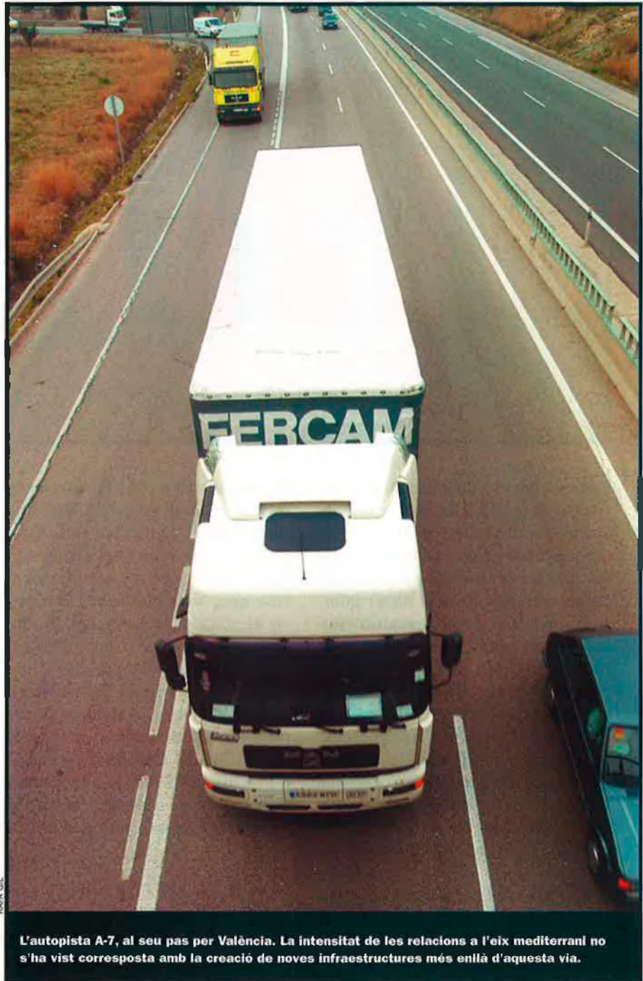
L'autopista A-7, al seu pas per València. La intensitat de les relacions a l'eix mediterrani no s'ha vist corresposta amb la creació de noves infraestructures més enllà d'aquesta via.

Una autopista, tanmateix, que continua sent tota de peatge, "que grava amb