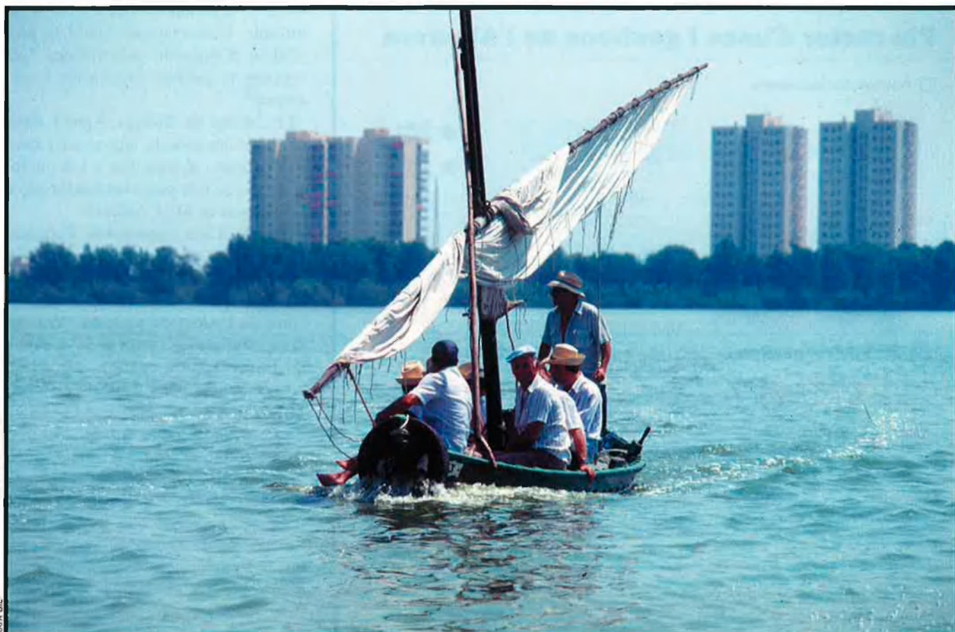
Aquesta escena es pot convertir en molt més habitual encara: una de les tradicionals barques de l'estany, a poca distància d'uns edificis. Sembla que el model que es persegueix és que els apartaments estiguen directament dins del cor del parc, per molt que això afecte la natura.

pervisió de cap autoritat". Aquest document assegura que "l'aigua de l'Albufera es troba en mans d'unes poques corporacions agràries –Junta de Desaigne de l'Albufera, Sèquia Reial del Xúquer, Canal del Túria i Comunitat de Regatge de Sueca–, sovint enfrontades a causa de velles disputes pel control del recurs, però inequívocament aliades en la seua bel·ligerància contra el parc; en conseqüència, les decisions sobre la gestió de l'aigua es prenen atenent exclusivament als interessos agrícoles que marquen els territoris, i, lògicament, de manera completament aliena als interessos ambientals de l'àrea".