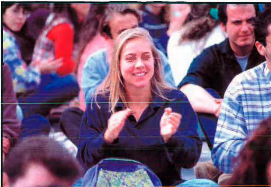
Els joves han ajudat a fer que el PP guanye. La imatge de dalt mostra l'estètica dels joves que tradicionalment s'han identificat amb aquest partit. La de sota, la dels joves de barri, fills de proletaris que en bona part donen suport a la política grandiloquent dels populars.