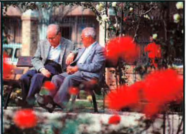
La pluralitat i la normalitat han estat les característiques del votant del Partit Popular. Els membres de minories ètniques; els joves; els jubilats; els operaris de classe mitjana i mitjana-baixa; els petits empresaris; els desafavorits... els votants que fan guanyador al partit conservador pertanyen a tots aquests segments, uns segments que, en teoria, no havien d'escollir la formació de José María Aznar.