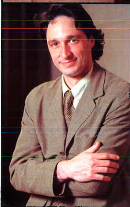
A dalt, el secretari general d'ERC, Josep-Lluís Carod-Rovira, candidat a la presidència de la Generalitat de Catalunya. A l'esquerra, Jordi Portabella, candidat a l'alcaldia de Barcelona.