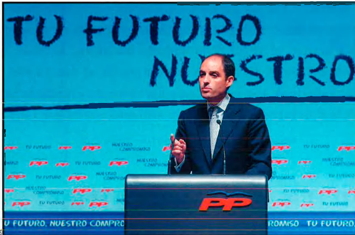
Francesc Camps, candidat del PP a la presidència de la Generalitat Valenciana. La incertesa de la situació al País Valencià ha fet que la seua activitat electoral siga reforçada amb la presència directa del capítol popular valencià i ministre de Treball, Eduardo Zaplana.

Campanya des de l'oposició a les Illes. El PP de les Illes, per la seva banda, s'enfronta amb la campanya electoral més decisiva de la seva història. Per primera vegada ho fa des de l'oposició i, a més, representa una part essencial de l'estratègia electoral del PP estatal.