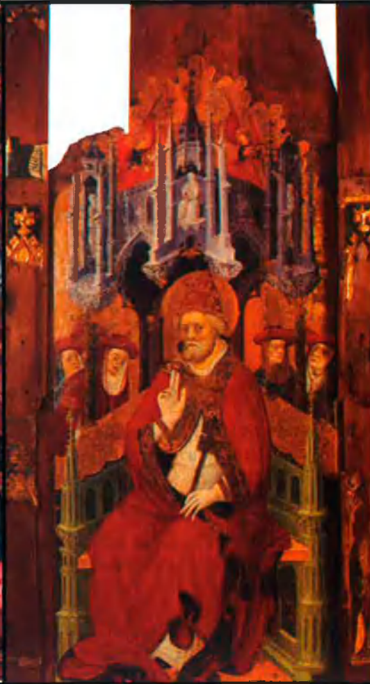
A l'esquerra, taula de Sant Pere in cathedra (representat com a papa), de Guillem Ferrer (segle XV). La taula es va trobar fa deu anys al sostre de l'ajuntament de Cinctorres, tapant unes goteres. A sota, l'espectacular creu processional de Traiguera, de Bernat Santalinea.