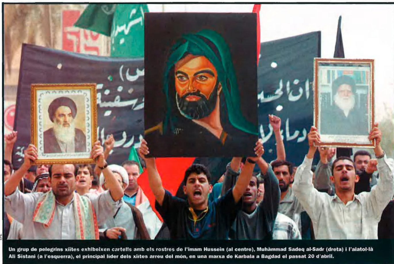
Un grup de pelegrins xiïtes exhibeixen cartells amb els rostres de l'imam Hussein (al centre), Muhàmmad Sadeq al-Sadr (dreta) i l'ayatol·là Ali Sistani (a l'esquerra), el principal líder dels xiïtes arreu del món, en una marxa de Karbala a Bagdad el passat 20 d'abril.

darrere d'aquesta mena d'objectius. Així i tot, espera que les protestes antiamericanes s'extingescen aviat i que la situació es tranquil·litze.