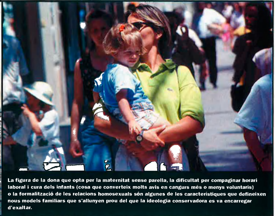
La figura de la dona que opta per la maternitat sense parella, la dificultat per compaginar horari laboral i cura dels infants (cosa que converteix molts avis en cangurs més o menys voluntaris) o la formalització de les relacions homosexuals són algunes de les característiques que defineixen nous models familiars que s'allunyen prou del que la ideologia conservadora es va encarregar d'exaltar.

Va ser a San Francisco (Califòrnia), la ciutat que s'havia transformat a poc a poc per mà d'una comunitat gai del tot visible, organitzada i polititzada, on, cap a la dècada dels noranta, coincidint amb l'envelliment d'una part d'aquesta comunitat i amb la voluntat (amb el fantasma de la sida de fons) de "canalitzar la sexualitat en pautes més segures" que, explica Manuel Castells, "els patrons d'interacció sexual es van tornar més estables", i on, consegüentment, "va brotar un nou moviment en la comunitat gai per obtenir el reconeixement institucional d'aquestes relacions estables com a famílies".