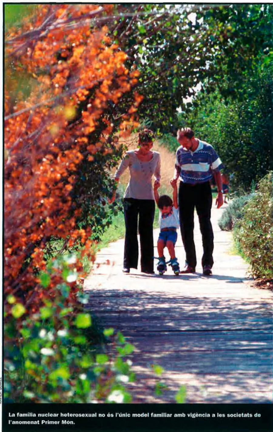
La família nuclear heterosexual no és l'únic model familiar amb vigència a les societats de l'anomenat Primer Món.