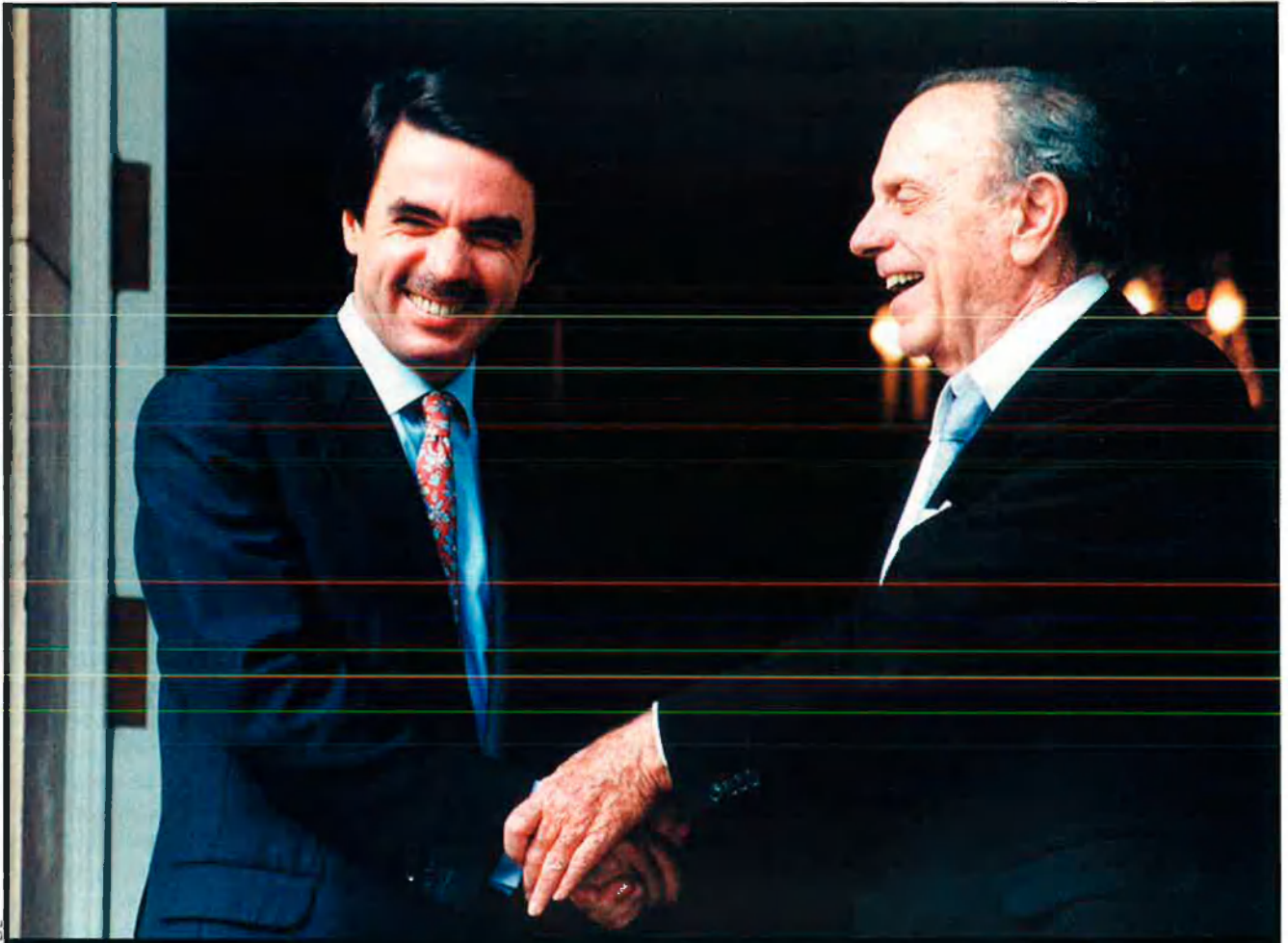
José María Aznar, al poc de ser nomenat president del Govern espanyol, amb Manuel Fraga, anima mater d'Alianza Popular. En els anys de la transició democràtica el partit es va mantenir fidel al franquisme. En els últims anys, però, intenta captar el catalanisme conservador.

tots els comicis menys els espanyols, plusmarca que és de 2000 i que es va aconseguir amb Josep Piqué com a cap de cartell. Aleshores era Alberto Fernández Díaz, germà de Jordi i successor de Vidal-Quadras, qui ocupava la presidència del partit. Vidal-Quadras va ser defenestrat el 1996, quan Aznar necessitava CiU per poder governar a Madrid. L'únic èxit electoral important d'Alberto Fernández Díaz va ser el ja esmentat de Piqué en les generals de 2000, eleccions en què Aznar va obtenir la majoria absoluta del Congrés. Seria precisament Piqué qui, l'any passat, es convertia en president del PP català desbancant Alberto Fernández Díaz. Piqué, que poc temps enrere havia teoritzat l'anomenat patriotisme constitucional, esdevenia el nou encarregat d'arreglar la situació del partit. Per fer-ho, ha