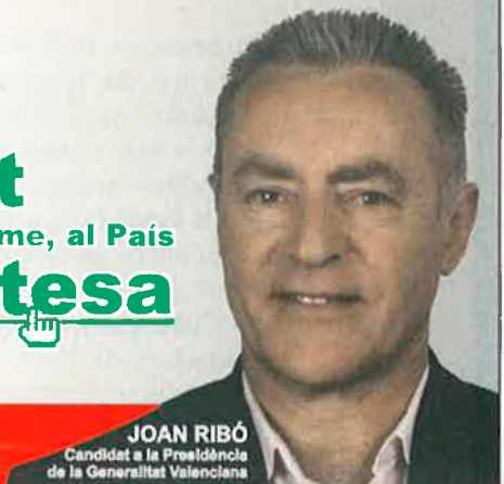
JOAN RIBÓ Candidat a la Presidència de la Generalitat Valenciana

Connecta't a l'esquerra, a l'ecologisme, al País a l'Entesa