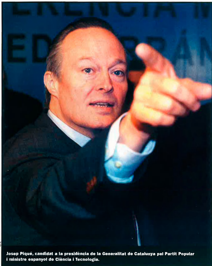
Josep Piqué, candidat a la presidència de la Generalitat de Catalunya pel Partit Popular i ministre espanyol de Ciència i Tecnologia.

Un altre exemple de nova incorporació a les files del PP que ha aconseguit un