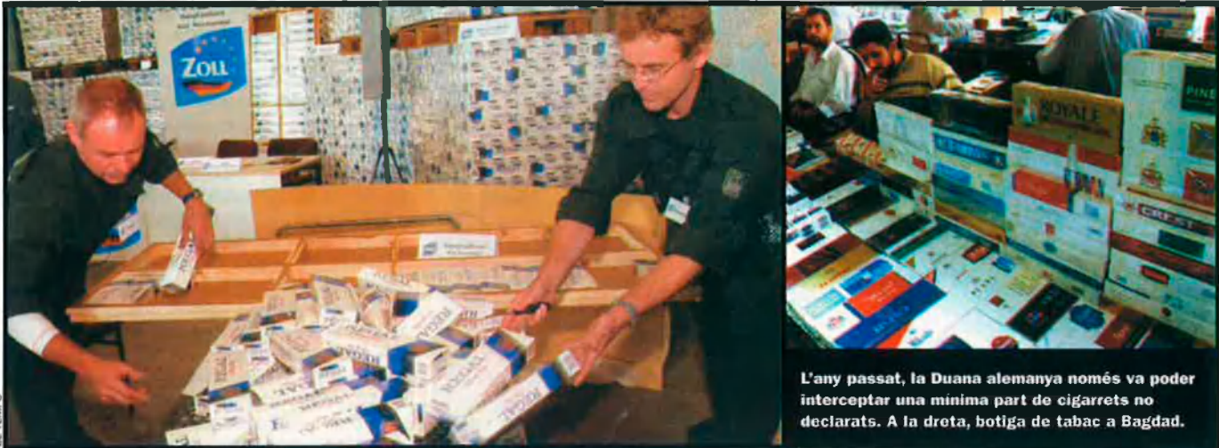
L'any passat, la Duana alemanya només va poder interceptar una mínima part de cigarrets no declarats. A la dreta, botiga de tabac a Bagdad.

tabac. La “legalitat dels negocis té prioritat”, diuen, de fet, no s’ha contravingut de cap de les maneres a les sancions de les Nacions Unides contra l’Iraq. O almenys, això és el que diu l’empresa.