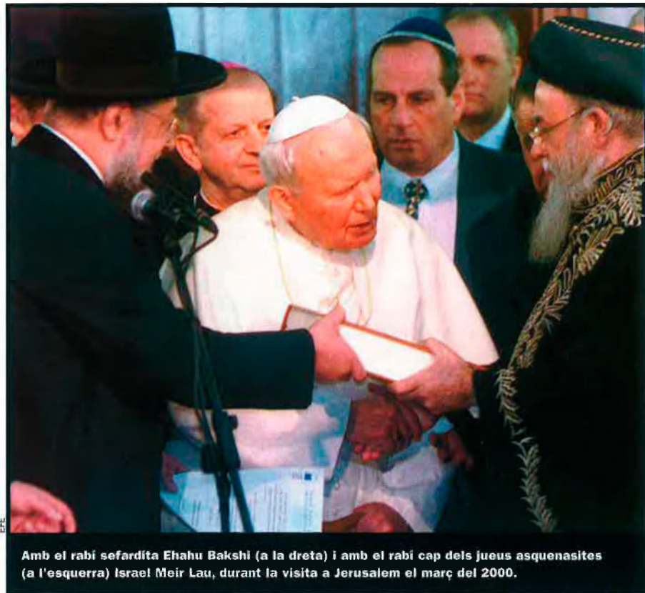
Amb el rabí sefardita Ehabu Bakshi (a la dreta) i amb el rabí cap dels jueus asquenasis (a l'esquerra) Israel Meir Lau, durant la visita a Jerusalem el març del 2000.

A Itàlia, ser cristià però no catòlic provoca, en primer lloc, ser testimoni d'una intolerància palesa. Sovint esclato en còlera quan alguns sacerdots catòlics critiquen altres cristians, els metodistes o els waldensians, com si el fet de tenir una història curta els fes irrellevants comparats amb la història mil·lenària de l'Església catòlica romana. Aquests sacerdots, de manera arrogant, em diuen: “ extra ecclesiam nulla salus ” (“Ningú que sigui fora de l'Església pot salvar-se”). Després de l'11 de setembre, un líder catòlic va comparar Bin Laden amb Luther i bé que li van aplaudir l'acudit.