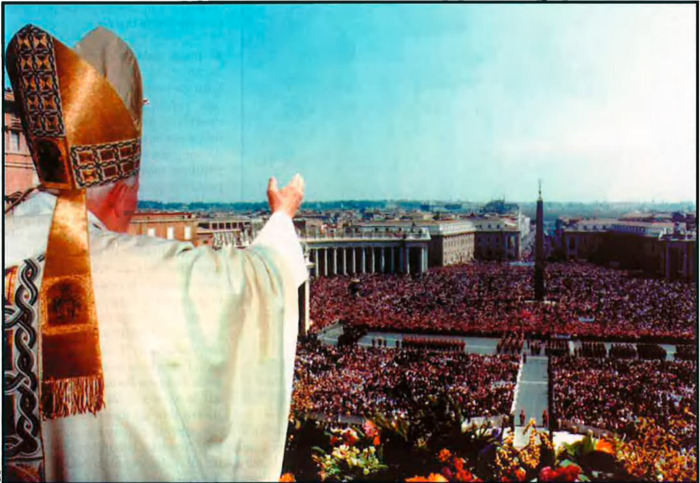
El sant pare beneeix urbi et orbi els fidels des de la plaça de Sant Pere, el 7 passat d'abril. A Itàlia, la successió del papa desperta tanta fascinació com la coronació a la Gran Bretanya, la diferència és que a Roma ningú no sap qui s'asseurà al tron, ni tan sols se sap quins seran els candidats.

El procés d'elecció, com tot a Itàlia, és excepcionalment complicat i confús. En el 1059, el papa Nicolau II va restringir l'elecció del pontífex als cardenals. En el 1586, Sixt V va fixar en 70 el nombre de cardenals que podien votar. Pau VI va excloure de les eleccions els cardenals que tenien més de 80 anys. Avui hi ha 156 cardenals, dels quals poden votar 106 –per la restricció d'edat–. D'aquests 106, tots excepte 12, han estat nomenats en el càrrec pel mateix Wojtyla. El futur “bisbe de Roma” ha d'aconseguir ser votat per dos terços. Cada elector escriu en la seva papereta “ Eligo in Summum Pontificem ” (“Elegeixo com a suprem pontífex”) seguit pel nom del seu candidat. Després, es dirigeix a l'altar i introdueix la papereta en l'urna tot dient “Crido com a testimoni Crist, el Senyor, Ell jutjarà que el meu vot el dono a