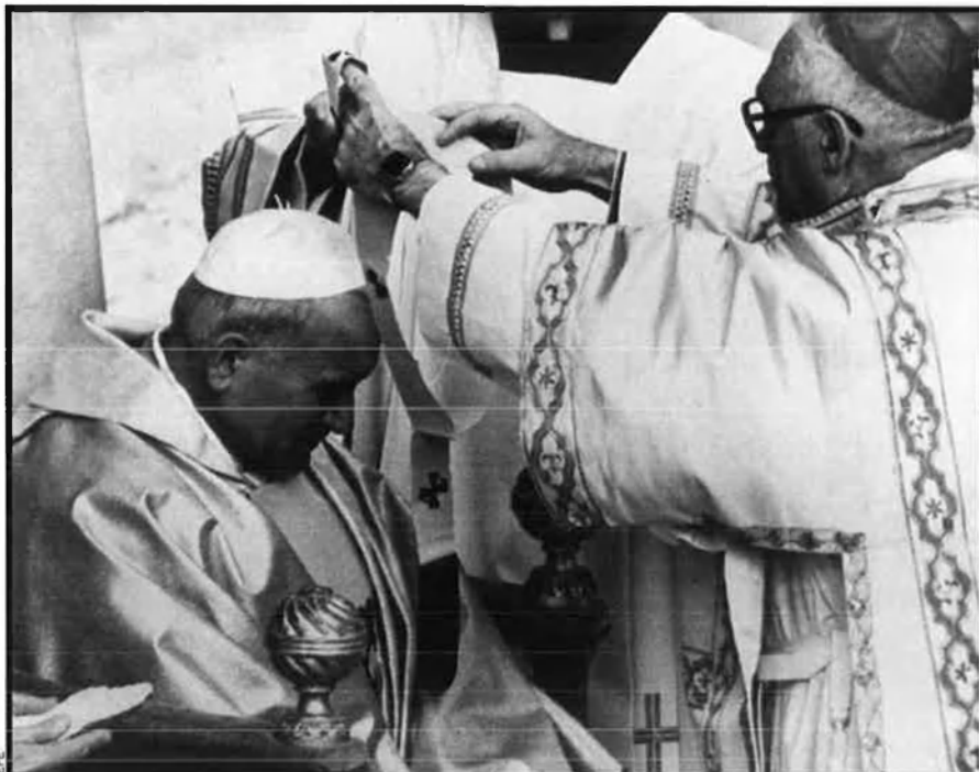
Cerimònia de coronació del papa Joan Pau II, oficiada pel cardenal Pericle Felici el 22 d'octubre del 1978. En aquell moment Wojtyla era un papa sorprenent per la seva afició a l'esport.

fet moure més jovent al món que mai no ho ha fet cap estrella del rock". Diuen els seus admiradors que ha rejuenit l'Església. Marco Tosatti, el corresponent de La Stampa en el Vaticà, afirma que "fa vint anys, aquest papa polonès quasi no era eclesialístic: esquiava, parlava de futbol... era tan vital que resultava natural que viatgés". I, probablement, aquestes ganes de veure món seran allò que més es recordi de Joan Pau II, les seves teatrals baixades de l'avió i la corresponent besada a terra. Un exemple més, diuen els seus partidaris, de l'activitat del pontífex.