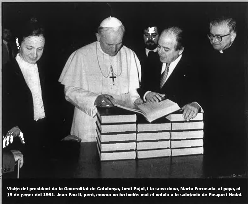
Visita del president de la Generalitat de Catalunya, Jordi Pujol, i la seva dona, Marta Ferrusola, al papa, el 15 de gener del 1981. Joan Pau II, però, encara no ha inclòs mai el català a la salutació de Pasqua i Nadal.