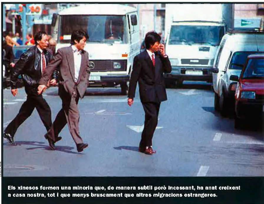
Els xinesos formen una minoria que, de manera subtil però incessant, ha anat creixent a casa nostra, tot i que menys bruscament que altres migracions estrangeres.