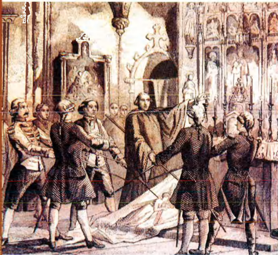
Els capitans i el conseller en cap de Barcelona, Rafael Casanova, juren defensar les llibertats de la ciutat.

abitants a les 5 h de la matinada del dia 16 prop de la porta de san Vicent, va capgirar qualsevol intent d'oposició. No eren només els esquadrans de Nebot, sinó una desordenada bandada de gent armada de la Marina, de la Ribera, de Xàtiva, que s'incorporaven a la marxa dels seguidors de Basset, el seu líder indiscutible. Abans d'arribar a les muralles, els sons dels 'caragols' convocaven una altra multitud d'homes i dones de l'Horta, que ven egües, carros o caminant i cridant iguals victors que els proferits per la gent dels gremis que, arraïmada a les muralles, esperava ansiosa la seua entrada a la ciutat.