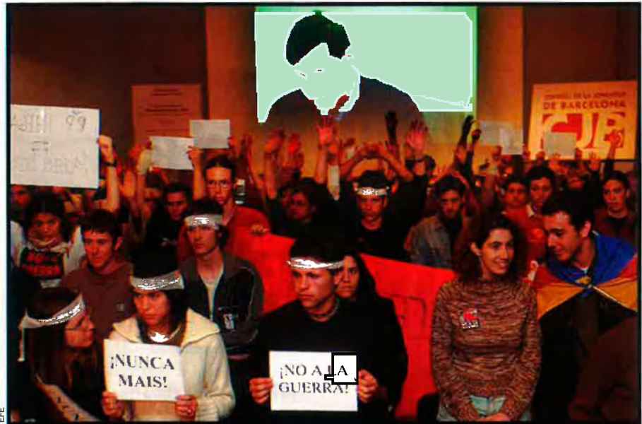
La presentació de la llista del Partit Popular a Reus va acabar convertida en un multitudinari acte de protesta, amb agressions incloses contra Alberto Fernández Díaz.

Siguin quins siguin els sondejos, sembla que la guerra a l'Iraq pot contribuir a desgastar el PP, tot i que cal remarcar que alguns sondejos, abans d'aquest conflicte, ja auguraven aquesta tendència a la baixa dels populars a Catalu-