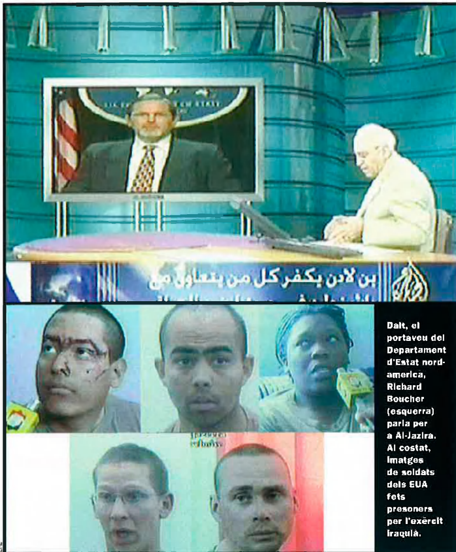
Dalt, el portaveu del Departament d'Estat nord-americà, Richard Boucher (esquerra) parla per a Al-Jazira. Al costat, imatges de soldats dels EUA fets presoners per l'exèrcit iraquetà.

la tasca de l'emissora, ahora que proclama que fa la guerra a l'Orient Mitjà per dur la llibertat a aquesta regió. També dimecres 26, els responsables de Wall Street van expulsar els dos corresponents de la cadena i hackers nord-americans boicotaven la web en anglès que acabava de posar en marxa Al-Jazira, segons fonts de la mateixa emissora. La cadena Fox va proposar que es bombardejara la seu d'Al-Jazira a Qatar. L'administració nord-americana, però, fa servir Al-Jazira, i els seus 50 milions d'espectadors, com l'únic recurs per fer arribar els seus missatges al món àrab.