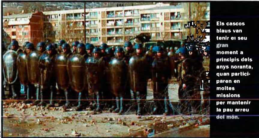
Els cascos blaus van tenir el seu gran moment a principis dels anys noranta, quan participaren en moltes missions per mantenir la pau arreu del món.

Consell, que ja eren cinc amb dret a veto (Rússia, els EUA, la Xina, França i Gran Bretanya); que el país que entrés