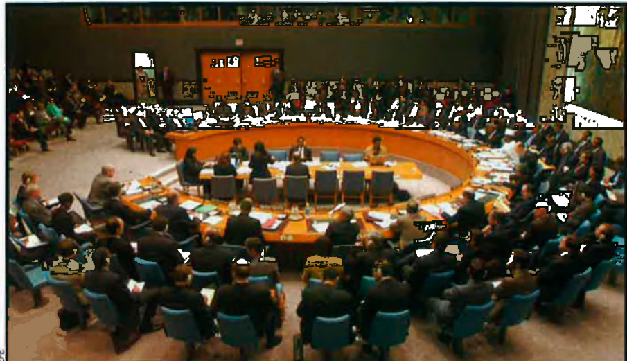
Les Nacions Unides han rebut un cop molt fort amb el menyspreu mostrat per George W. Bush al Consell de Seguretat d'aquesta organització.

Tot per terra. Amb aquesta actitud, Bush tira per terra tot el que el seu país també havia ajudat a construir des de la fi dels anys seixanta: xarxes d'organitzacions internacionals i aliances comercials i militars. L'equació era la següent: els EUA es comprometien a protegir militarment els seus aliats europeus i asiàtics i els obrien l'accés al seu mercat, a canvi, rebien suport diplomàtic i logístic d'uns