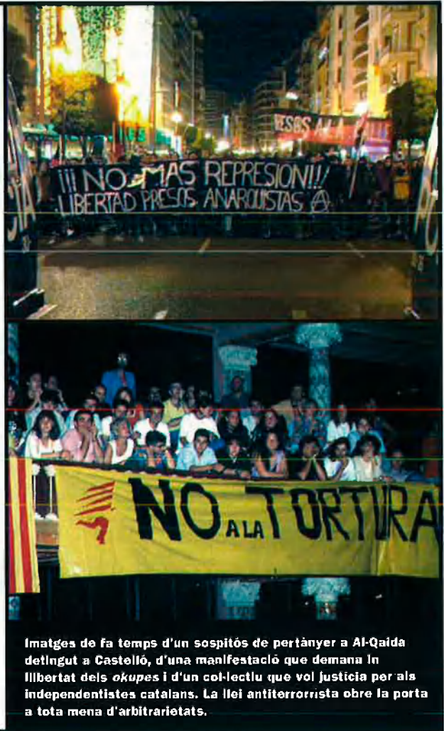
Imatges de fa temps d'un sospitós de pertànyer a Al-Qaida detingut a Castelló, d'una manifestació que demana llibertat dels okupes i d'un col·lectiu que vol justícia per als independentistes catalans. La llei antiterrorista obre la porta a tota mena d'arbitrarietats.

ga relació amb els plans de Bin Laden. Però, per si de cas, es considera aquesta possibilitat.