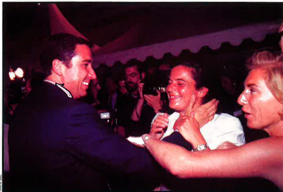
Dalt, Eduardo Zaplana celebra el triomf a les passades eleccions a la Generalitat. El Partit Popular obtenia per primera vegada la majoria absoluta al País Valencià.

El Bloc Nacionalista Valencià, per la seua banda, va obtenir els millors resultats de la seua història. Va quedar en les eleccions del 1999, amb un 4,6% dels vots, a les portes d'entrar a les Corts. Li faltaven així uns pocs milers de sufragis per superar la llarga travessia del desert del nacionalisme valencià. El Bloc, abans com a Unitat del Poble Valencià, s'ha presentat a totes les eleccions valencianes des del 1983, excepte l'any 1987, en què va anar coalitzat amb Esquerra Unida, sense aconseguir en cap ocasió superar la que ha estat la fatídica barrera del 5% establerta a l'Estatut