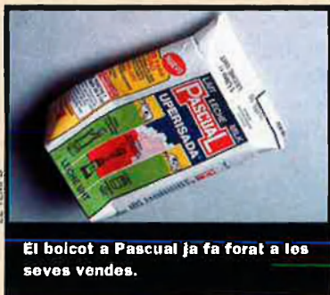
El boicot a Pascual ja fa forat a les seves vendes.

El boicot contra Leche Pascual es va iniciar fa dues setmanes, quan l'empresa va deixar de comprar llet a explotacions ramaderes catalanes després de la negativa del Govern català a permetre la comercialització amb el nom de iogurt d'unes postres de Pascual.