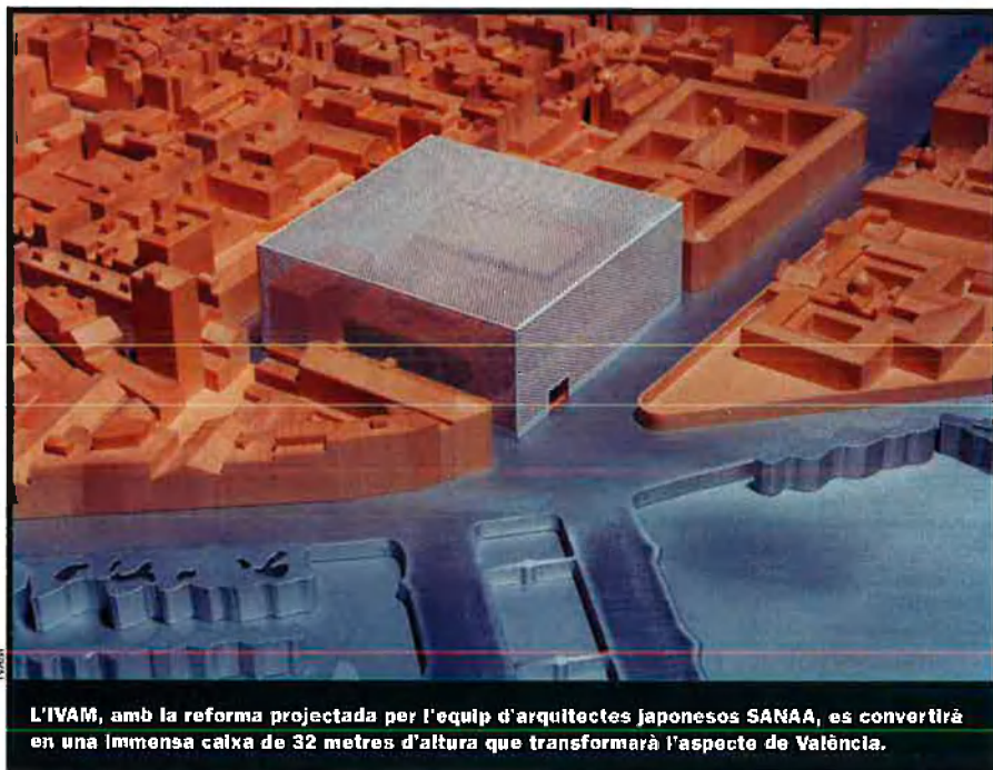
IVAM L'IVAM, amb la reforma projectada per l'equip d'arquitectes japonesos SANAA, es convertirà en una immensa caixa de 32 metres d'altura que transformarà l'aspecte de València.