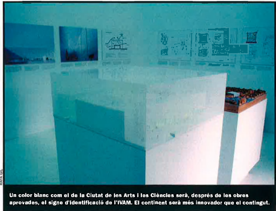
Un color blanc com el de la Ciutat de les Arts i les Ciències serà, després de les obres aprovades, el signe d'identificació de l'IVAM. El continent serà més innovador que el contingut.