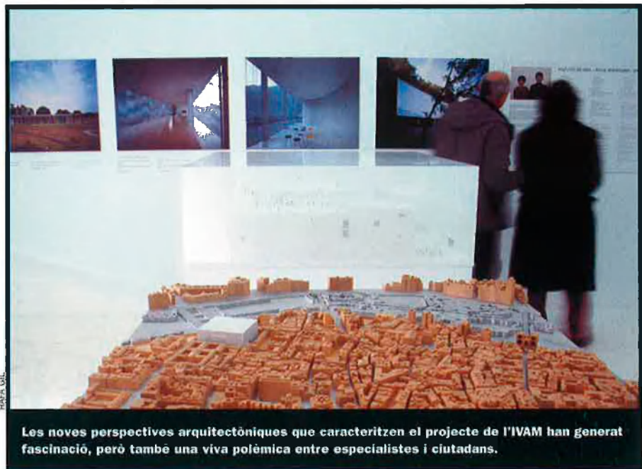
Les noves perspectives arquitectòniques que caracteritzen el projecte de l'IVAM han generat fascinació, però també una viva polèmica entre especialistes i ciutadans.