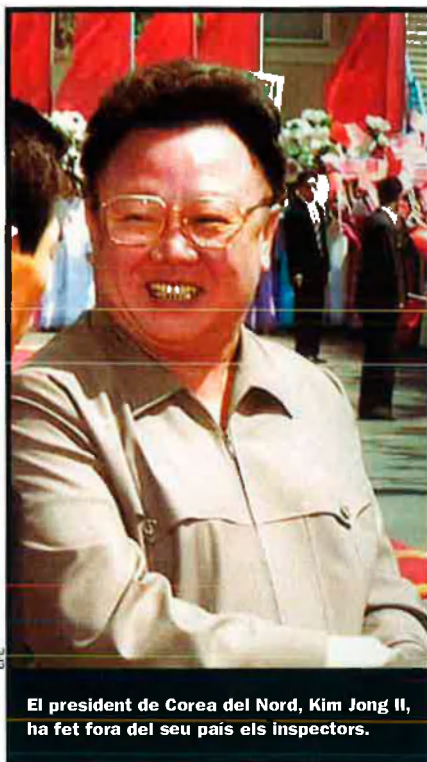
El president de Corea del Nord, Kim Jong II, ha fet fora del seu país els inspectors.

—Els dirigents de l'Iran mantenen el que ells anomenen un "programa nuclear honest" que, segons diuen, tan sols serveix per a fins pacífics. A diferència dels dirigents nord-coreans, els iranians s'han mostrat sempre disposats a dialogar. Cal comprometre Teheran amb els criteris convencionals de control del Consell d'Energia Nuclear; tan sols així es pot reduir la malfiança.