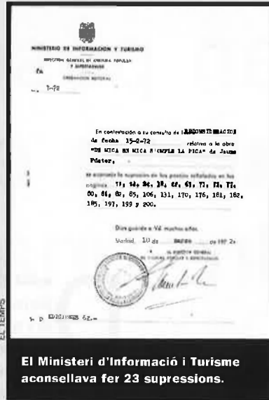
El Ministeri d'Informació i Turisme aconsellava fer 23 supressions.

La denominació de "grisos" referits als agents de la policia no és acceptada i tampoc un comentari referit al sistema "que posaven en pràctica els bdfies".