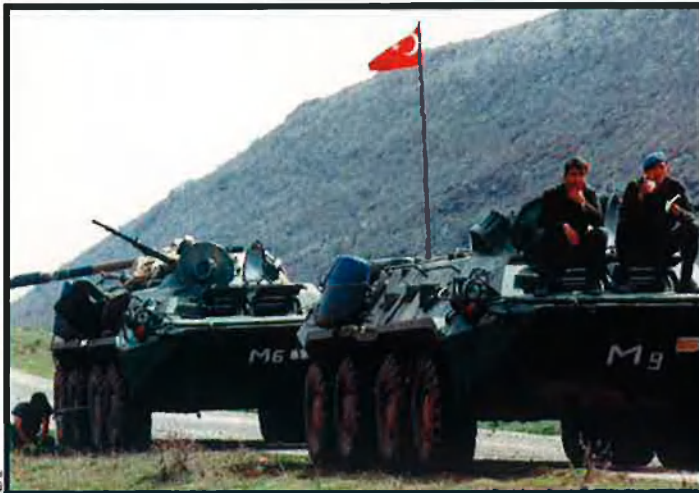
A l'esquerra, soldats turcs a la frontera amb l'Iraq. Turquia vol ocupar el nord del país aprofitant la invasió dels EUA. A la dreta, base d'Incirlik, la principal dels EUA a Turquia.