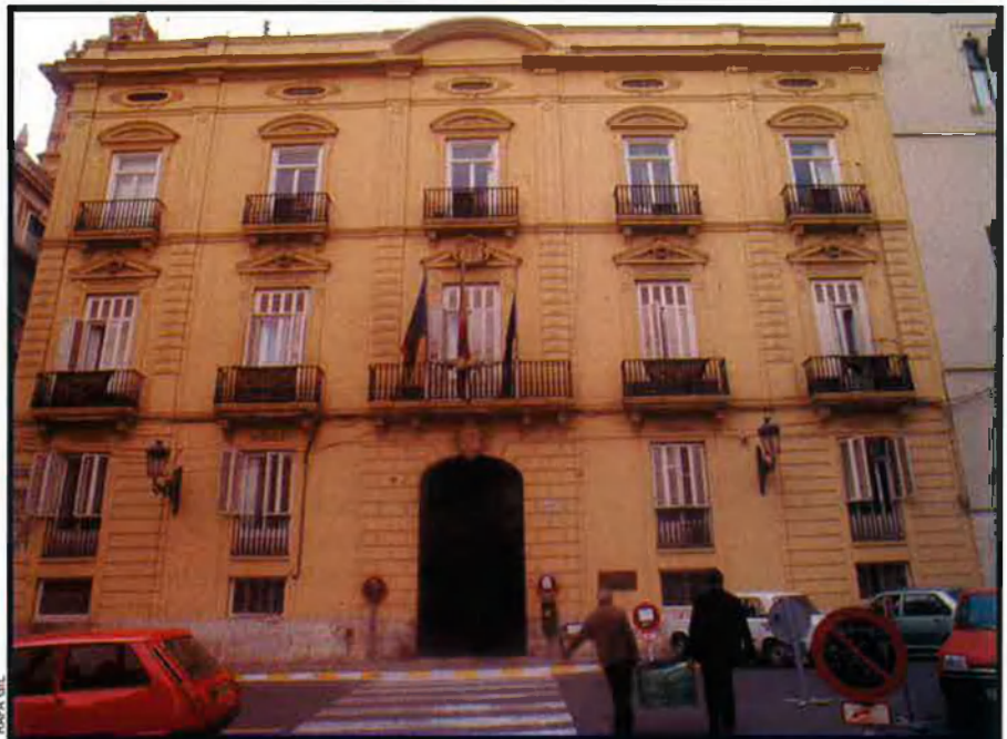
Dalt, la seu de la Diputació de València. El PSPV-PSOE, gràcies al pacte amb Esquerra Unida - Entesa, podria recuperar "l'ajuntament dels ajuntaments". A sota, l'actual repartiment d'escons a les dues diputacions que podrien canviar de majoria: Alacant i València. Un lleuger augment del vot d'esquerra seria suficient per capgirar la situació.

A causa dels moviments de població, el partit judicial d'Alcoi, on el PP va obtenir dos diputats i el PSPV un, es quedarà amb dos, que es repartiran les dues formacions majoritàries, i el partit de Villena, que té només un representant que és ara del PP, en tindrà dos que es repartiran també aquestes formacions