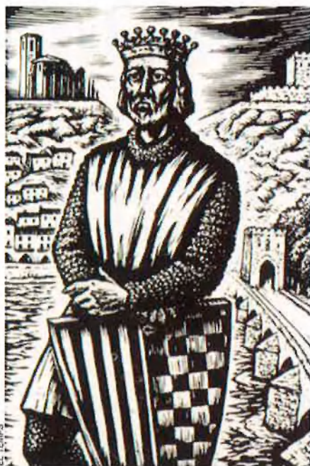
Frontispici, gravat al boix, obra d'Antoni Ollé i Pinell, que evoca la figura de Jaume d'Urgell.

—La insurrecció de Bunyol és un fet tan poc conegut com revelador de la importància de l'urgellisme al país. Una de les senyories de la casa d'Urgell era, precisament, la baronia de Bunyol. Seguint ordres secretes de Jaume d'Urgell i dels seus oficials, allí es va preparar una insurrecció contra l'autoritat reial. Els jurats de Valèn-